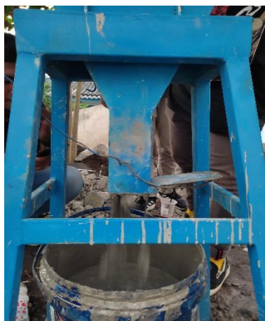
Gambar 4: Uji v-funnel modifikasi 3

Gambar 3 adalah dokumentasi hasil pengujian j-ring tester beton modifikasi 3 dengan capaian diameter 50 cm dengan waktu yang paling efektif adalah 2,71 detik sehingga dinyatakan SCC. Gambar 4 dokumentasi dari pengujian v-funnel tester sehingga diketahui waktu paling efektif pasta beton untuk melewati celah cetakan adalah 7,56 detik.