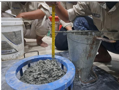
Gambar 2: Uji slump beton normal

Slump yang dilakukan pada benda Dari gambar 2 diatas uji slump beton normal didapatkan hasil penurunan 6 cm. Sehingga tidak dapat melewati j-ring tester . Oleh karena itu tidak bisa dinyatakan sebagai beton SCC.