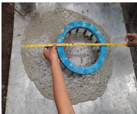
Gambar 3: Uji j-ring modifikasi 3

Slump yang dilakukan pada benda Dari gambar 2 diatas uji slump beton normal didapatkan hasil penurunan 6 cm. Sehingga tidak dapat melewati j-ring tester . Oleh karena itu tidak bisa dinyatakan sebagai beton SCC.